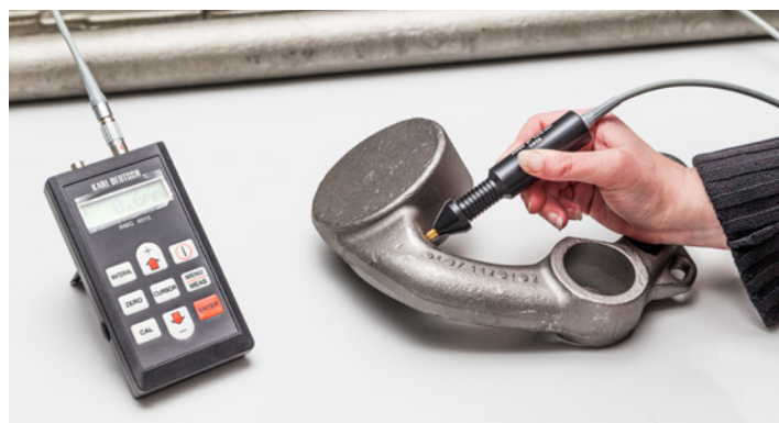
Karl Deutsch RMG 4015

Unsere Kunden stellen höchste Ansprüche an uns – diesen wollen wir auch weiterhin gerecht werden! Die an den Schmiede- sowie Wärmebehandlungsprozess anschließende Oberflächenrisssprüfung ist ein Prüfverfahren, um Oberflächenfehler zu identifizieren und, soweit es die gültigen Normen sowie Kundenspezifikationen zulassen, nachzubearbeiten sowie